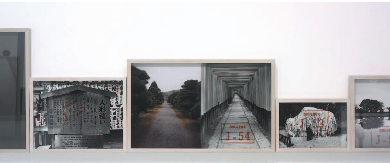
Sophie Calle *Douleur exquise*, *Avant la Douleur*, 1984/2003. Photographie, broderie, lin, aluminium, encadrement.

Aunque lo vivencia desde adentro, lo describe con el lenguaje desapasionado de una